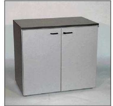
code 113: Armadietto portadoc. con chiave Filing cabinet with lock - h=75 cm