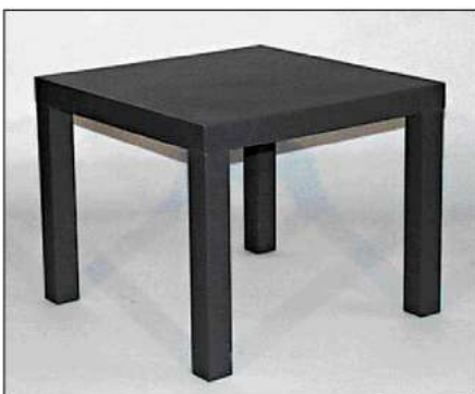
code 118: Tavolino basso Low table