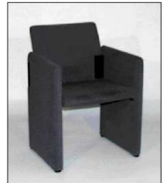
code 117: "Deko" - Poltroncina imbottita, grigio Small upholstered chair, grey