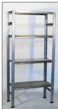
code 121: Scaffalatura modulare in metallo (per ripostigli) Modular metal shelving (for store rooms)