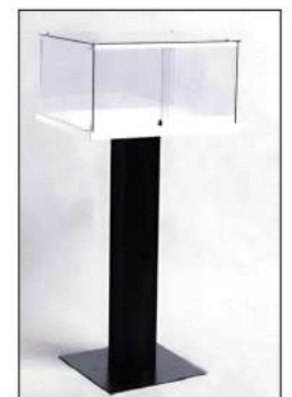
code 134: Vetrina con base nera e teca in cristallo 70x60h=105/140 Glass display case with black base, 70x60xh=105/140