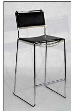
code 116: Sgabello alto per reception Barstool