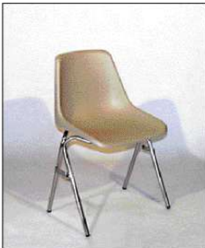
code 114: Sedia a scocca colore beige Chair with plastic body