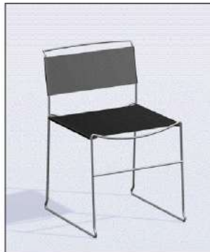
code 115: Sedia Jodi, seduta in pelle nera Metal chair, black leather