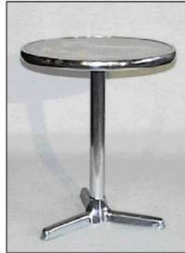
code 112: Tavolino rotondo, grigio/nero Round table, grey/black - cm Ø 70xh75